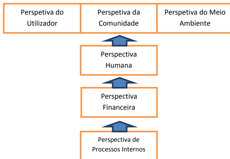
Gráfico 2.- Modelo BSC de Bastidas-Feliu

Deste modo, Bastidas e Feliu (2003) propõem um modelo alternativo, conforme se apresenta no Gráfico 2: